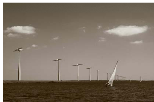
(Auf dem Eemmeer)