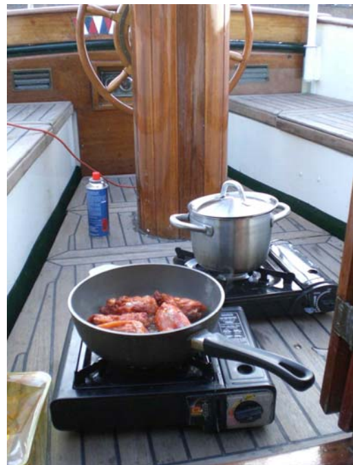
(Kochen, hier ganz schlicht)