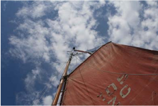
(Die „braune Flotte“ der Niederlande)