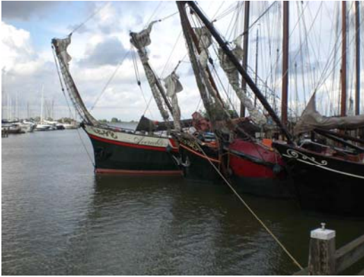
(Traditionssegler beherrschen nicht nur im Hafen das Bild ...)