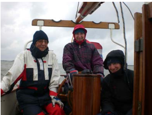
(Crew, gut gelaunt im Regen ...)