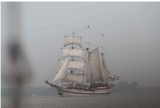
(... sondern auch als unheimliche Begegnung auf dem Meer)