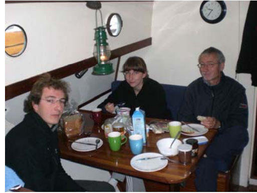
(... und beim Frühstück im Salon)