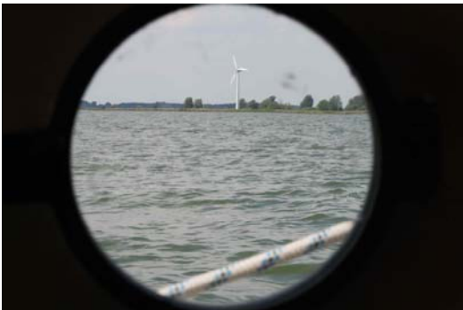
(Ausblick durchs Bullauge)