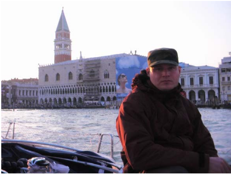
Venedig - das war's dann wieder mal